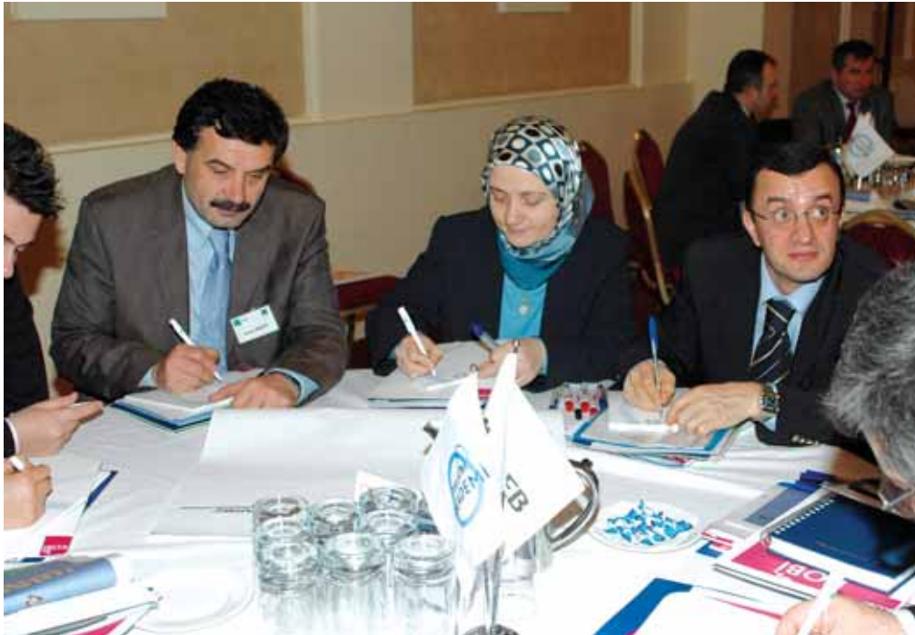
Grup 3 Zigana