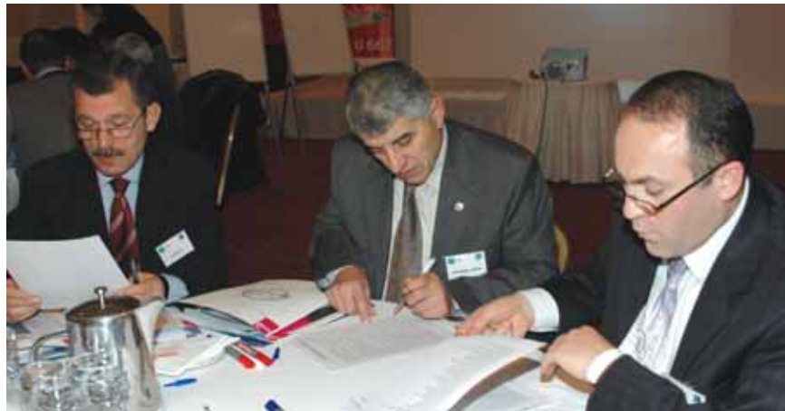
Grup 2 Karincalar

Trabzon'un dış ticaret payının artması, dış ticaret yapan firma sayısını da artırmakta, bu eğilim, dış ticaret konusunda nitelikli eleman ihtiyacını doğurmaktadır. Bundan dolayı da, dış ticaret konulu eğitim ve seminerlerin yaygınlaştırılması bir görev olarak ortaya çıkmaktadır.