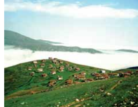
Sultan Murat Eğrisu Yaylası