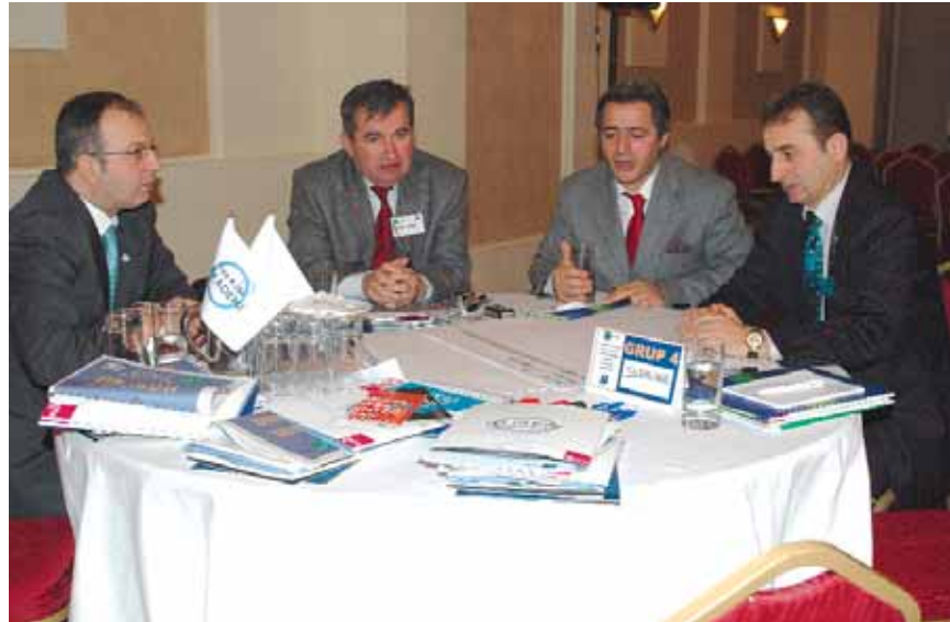
Grup 4 Serander

■ Gümrükleme, acentecilik, sigortacılık, akaryakıt bakım atölyeleri gibi işkollarına duyulan ihtiyaç artmaktadır. Bu alanlardaki hizmet kalitesinin artırılması gerekmektedir. Hizmet kalitesine bağlı olarak kalifiye eleman ihtiyacı da artmakta, mesleki ve hizmet içi eğitimlerin artırılması gerekmektedir. Gemi adamı yetiştirme, lojistik meslek okulu, ilkokullarda trafik derslerinin verilmesi bu eğilimin işaret ettiği görevler olarak belirlenmiştir.