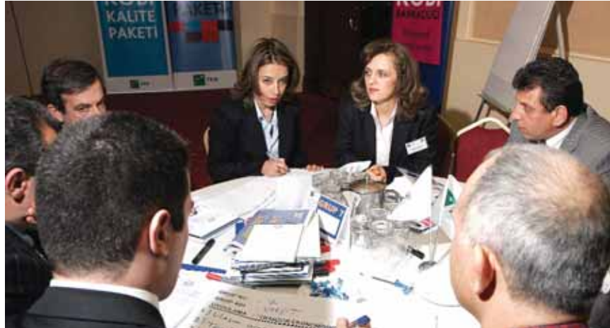
Grup 7 Vargit

■ Yatırım finansmanı ihtiyacı artmaktadır. Sermaye ihtiyacı artış sergilemekte, kredi ve leasing ihtiyacı artmaktadır. STK'ların bankalar ile yatırımcıyı buluşturmasına ihtiyaç bulunmaktadır. Yatırım finansmanı ihtiyacı arttıkça yerli ortaklık ihtiyacı da artış sergilemekte, halka arzların önemi artmaktadır. Aracı danışmanlık hizmetlerinden faydalanmak gerekliliği oluşmaktadır. Yerli ortaklık kadar yabancı ortaklık ihtiyacında da artış gözlemlenmekte, global sermayenin ülkeye girişi daha fazla önem kazanmaktadır. Bununla birlikte teşvikler de önem kazanan başka bir eğilim olmaktadır.