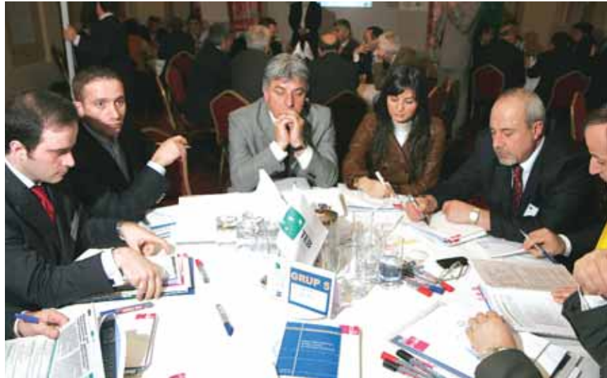
Grup 5 Öz Zigana

■ Mevcut sanayinin ar-ge gücünün artması gerekmektedir. Bu eğilime bağlı olarak araştırmacı teknik işgücü ihtiyacı gündeme gelmektedir. Buna yönelik olarak üniversite - sanayici işbirliğine ve döner sermayenin kaldırılmasına ihtiyaç duyulmaktadır. Mevcut sanayinin ar-ge gücünün artırılabilmesi için laboratuvar ihtiyacının da karşılanması gerekmektedir. Teknopark, Tekmer ve üniversitelerden bu konuda destek alınması gerekmektedir.